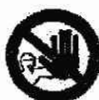
Divieto di accesso alle persone non autorizzate