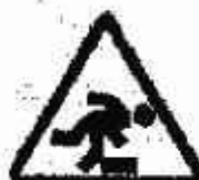
Pericolo di Inciampo