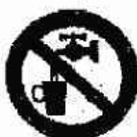
Acqua non potabile