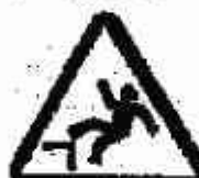
Caduta con dislivello