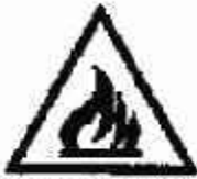
Materiali infiammabili o alta temperatura

- pittogramma nero su fondo giallo, bordo nero (il giallo deve coprire almeno il 50% della superficie del cartello).