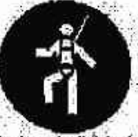
Protezione individuale obbligatoria contro le cadute