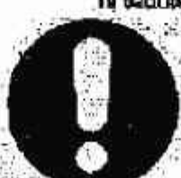
Obbligo generico (con eventuale cartello supplementare)