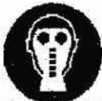
Protezione obbligatoria dalle vie respiratorie