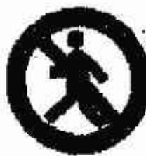
Vietato ai pedoni