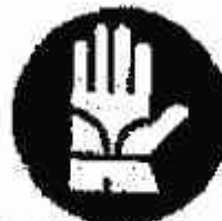
Guanti di protezione obbligatoria