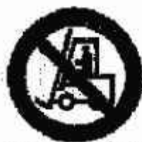
Vietato ai carrelli di movimentazione