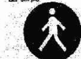
Passaggio obbligatorio per i pedoni