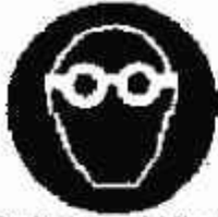
Protezione obbligatoria degli occhi

- forma rotonda, - pittogramma bianco su fondo azzurro (l'azzurro deve coprire almeno il 50% della superficie del cartello).