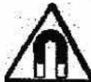
Campo magnetico intenso