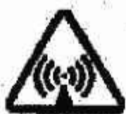
Radiazioni non ionizzanti