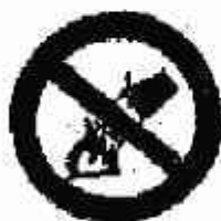
Divieto di spegnere con acqua