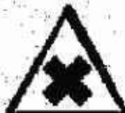
Sostanze nocive o irritanti