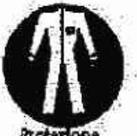
Protezione obbligatoria del corpo