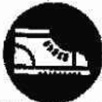
Calzature di sicurezza obbligatorie