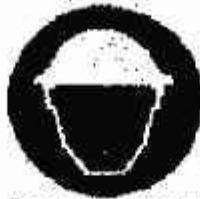
Casco di protezione obbligatorio