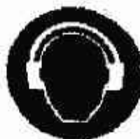
Protezione obbligatoria dell'udito