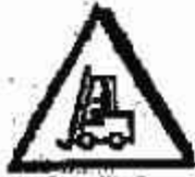
Carrelli di movimentazione