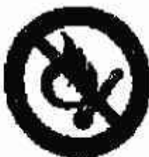
Vietato Fumare o usare fiamme libere