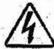
Tensione elettrica pericolosa